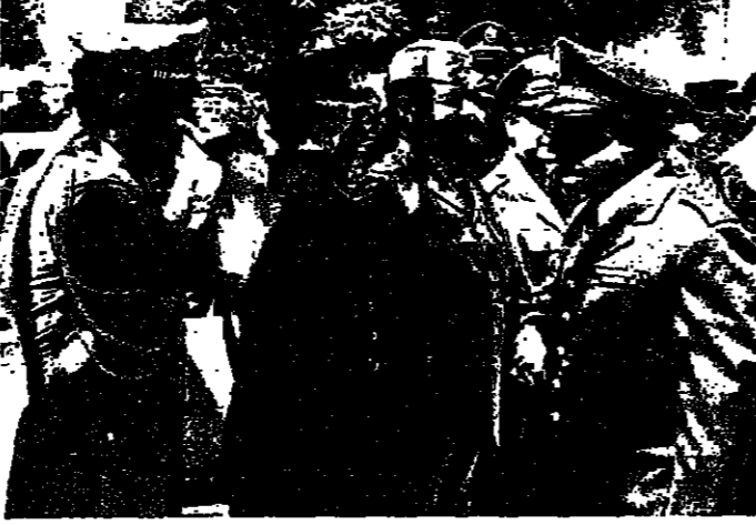
العميد الركن خوري يضع اكليلاً من الزهر على النصب التذكاري

احتفل أمس عيد الجيش اللبناني في بيروت والمناطق ، واتيحت احتفالات شهداء كبار العسكريين وشملت عروضاً للوحدات . وقد اقيم عند الساعة العاشرة قبل ظهر امس ، احتفال في ساحة النصب التذكاري للجندي المجهول - المتصغير برئاسة قائد الجيش العميد الركن فكتور خوري وحضور رئيس الاركان العميد المجدد من طريه وكبار الضباط والقادة ، والتمتعين العسكريين المبرزين والوفود من الجبهة العلمية قوى الامن الداخلي ، والجبهة العلمة والاعلام ورابطة المحاربين القتلاء . افتتح الاحتفال بالتشديد الوطني . وبعد ان اقيمت التشملة وضع قائد الجيش اكليلاً من الزهر على النصب التذكاري للجندي المجهول ، ثم تقدمت الوفود الاخرى ووضعت اكليل الزهر على النصب .